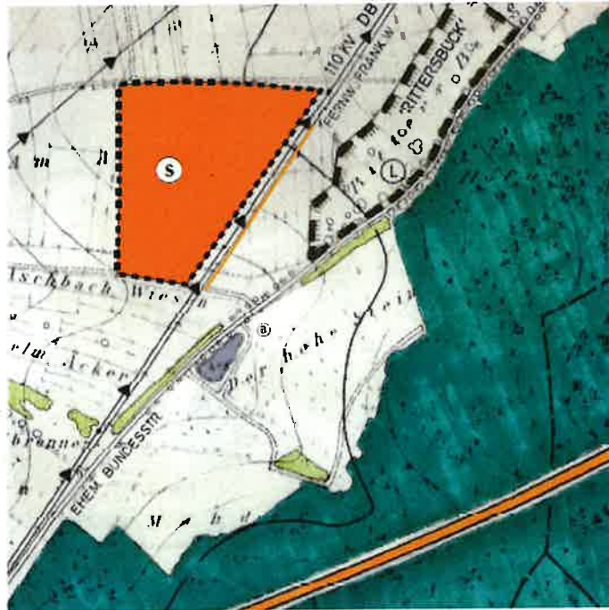
Lageplan des Änderungsbereichs (keine maßstabsgerechte Darstellung)